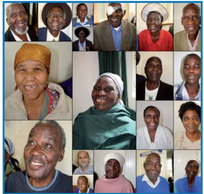
Lächeln von allen Seiten dank MMI-finanzierter Augenoperationen

“Ich danke MMI dafür, dass meine Operation möglich gemacht wurde.”